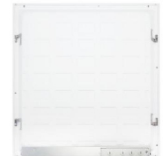
ARRIERE / BACK