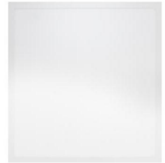
DEVANT / FRONT